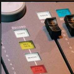
Boutons de programmation SmartFade